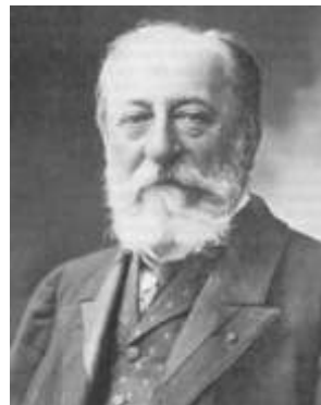
Charles Camille Saint-Saëns